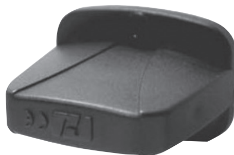
オプション レシーバー

送信機は最大 50m 程離れた場所から機器を操作することができます。A ボタンを押すと噴霧を開始し、B ボタンでストップします。