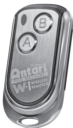
オプション トランスミッター ワイヤレスコントローラー W-1

ワイヤレスリモートコントロールシステムは送信と本体リア側に搭載されているレーザーからなります。