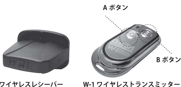
ワイヤレスレシーバー