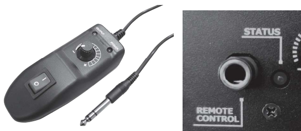
Z-3 有線コントローラー